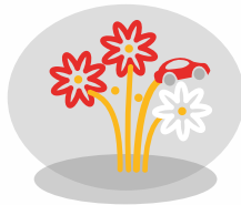
Beilage Ihrer Werbemittel