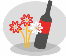
Beilage Ihrer Produkte