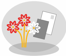
Beilage Ihrer individualisierten Grußkarten